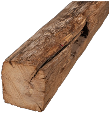
Balken Fi/Ta/Fö Altholz Typ 4A | handgehackt, grob gereinigt | 100-150 mm